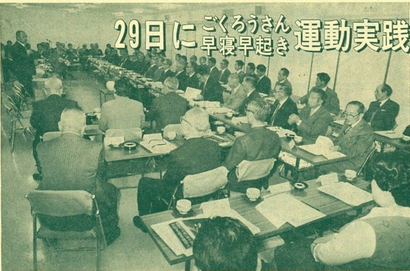
「ごころうさん」早寝早起き運動の中央推進委員会であいさつする市長