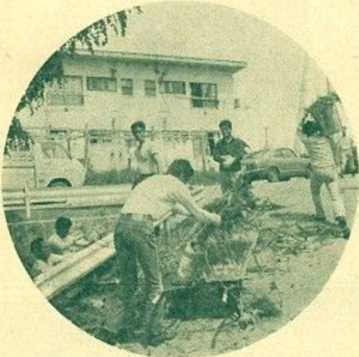
朝からみんなで町内清掃