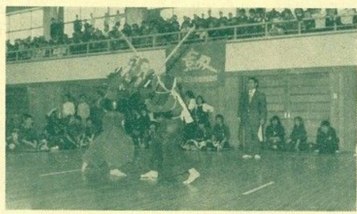
▲ 火花散る剣道試合(中学男子)