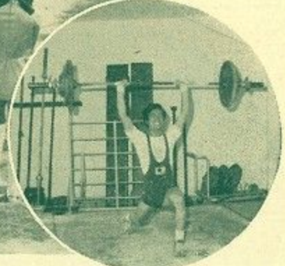
▲ ウェイトリフティング

さわやかに晴れわたった五月空のもと、「友情・健康・忍耐」をスローガンに掲げ、第三十一回市民体育大会が五月八日、市内法蓮町の池運動公園陸上競技場を中心に市内四十四会場で開催された。五月晴れのスポーツ日和に恵まれて大会には全市民の割にあたる二万七千人が参加し、二十六種目の競技に日ごろきたえた技を競い合いました。