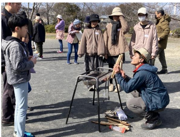
■キャンプイベント