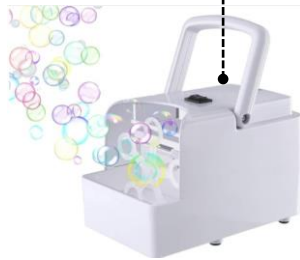
電動シャボン玉製造機 11.4 × 10.5 × 18cm(1台)