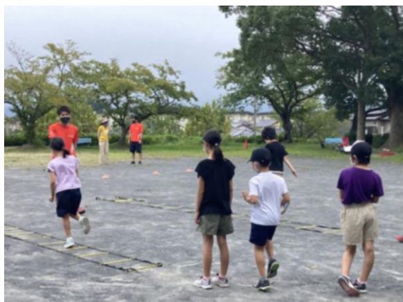
■スポーツイベント