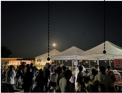
ライト全長15m (3本) テント3m × 3m (5張)