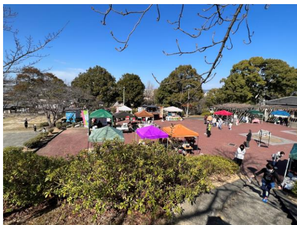
■マルシェイベント