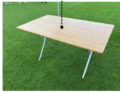
テーブル (5台) 720 × 1,215 × 660(h)mm